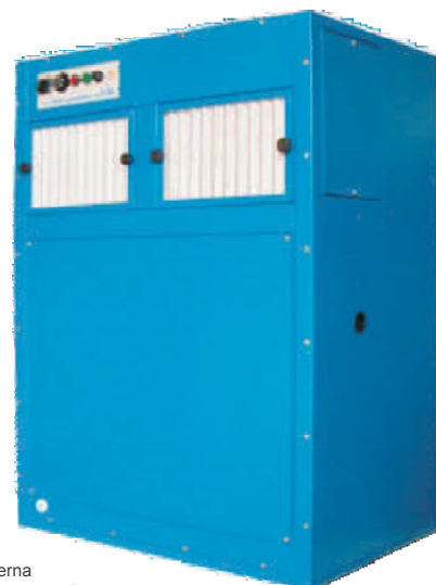
Serie ACU-F - Vista interna Серия ACU F – Вид внутренней части