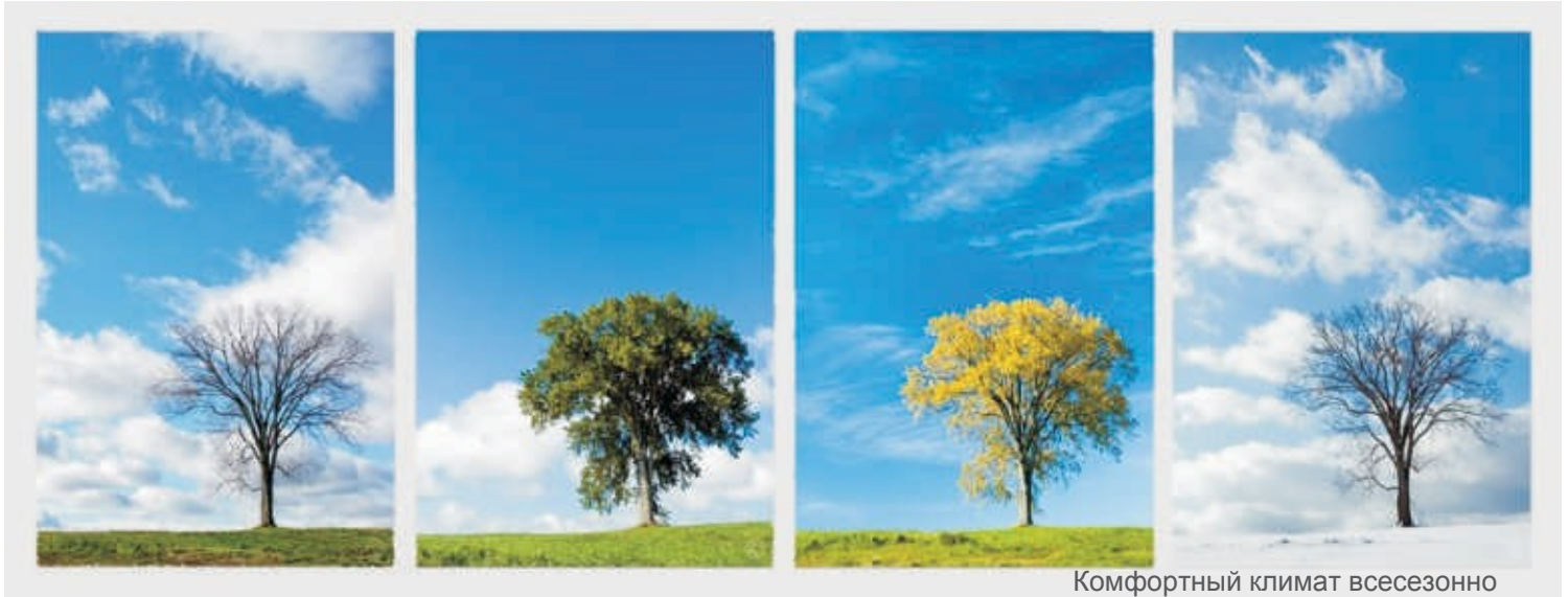
Комфортный климат всесезонно