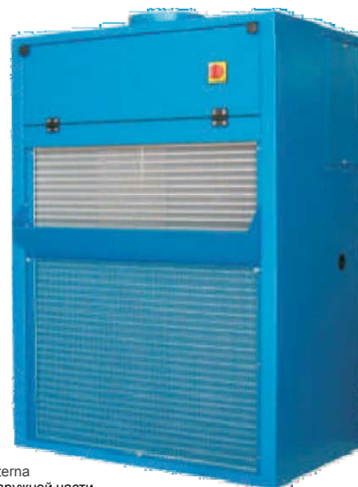
Serie ACU-F - Vista esterna Серия ACU F – Вид наружной части

Кондиционеры могут оснащаться COES устройством, которое гарантирует продолжительную работоспособность в условиях кратковременных повышений температуры до 80°C. Также они могут комплектоваться электронагревателем для обогрева кабины, расширяя допустимый рабочий диапазон по температуре до -40°C.